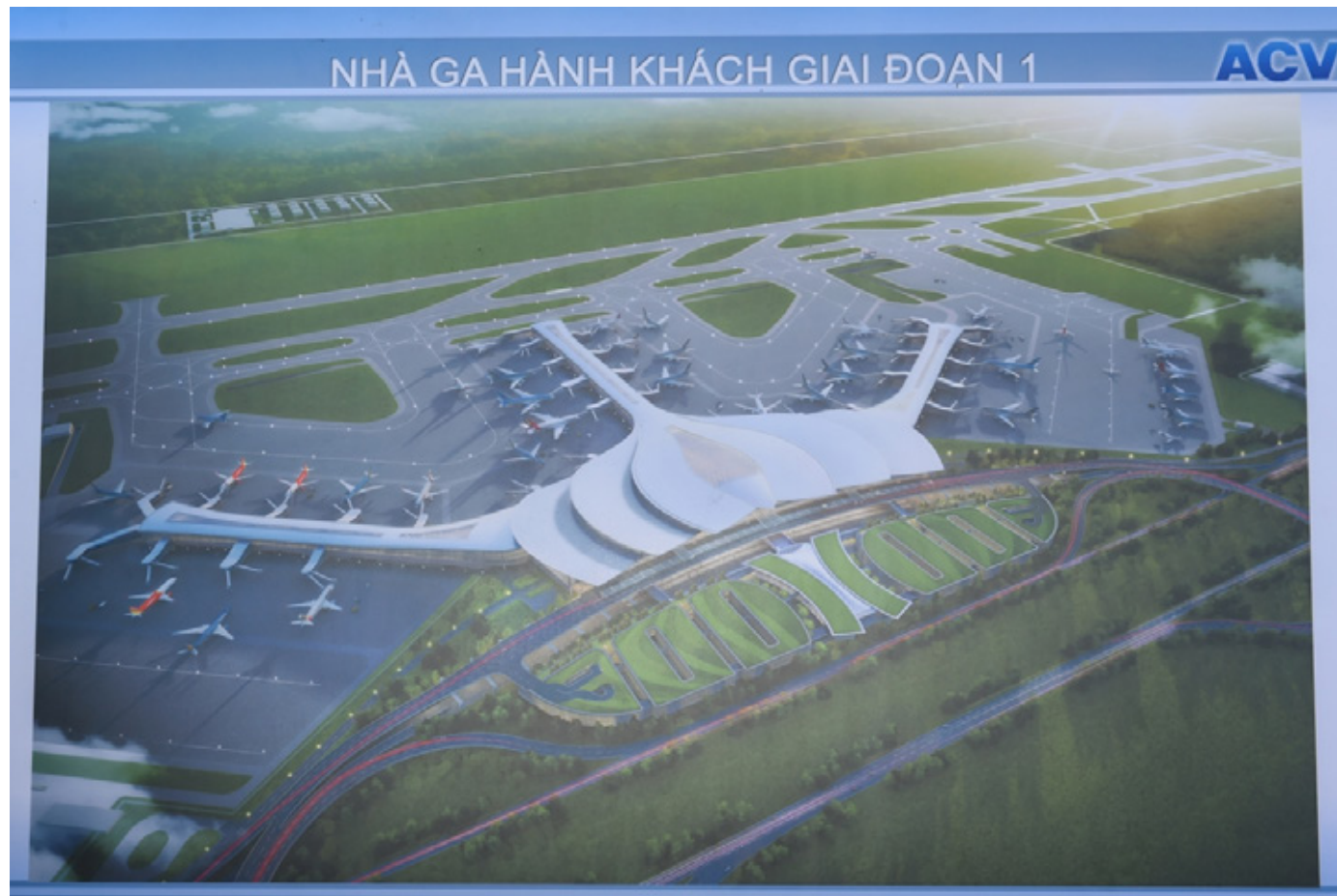
Phối cảnh nhà ga hành khách sân bay Long Thành giai đoạn 1.

Ngày 25/5, Văn phòng chính phủ vừa có văn bản số 3416/VPCP-CN về việc triển khai dự án Cảng Hàng không quốc tế Long Thành gửi Bộ GTVT, UBND tỉnh Đồng Nai và Tổng công ty Cảng Hàng không Việt Nam.