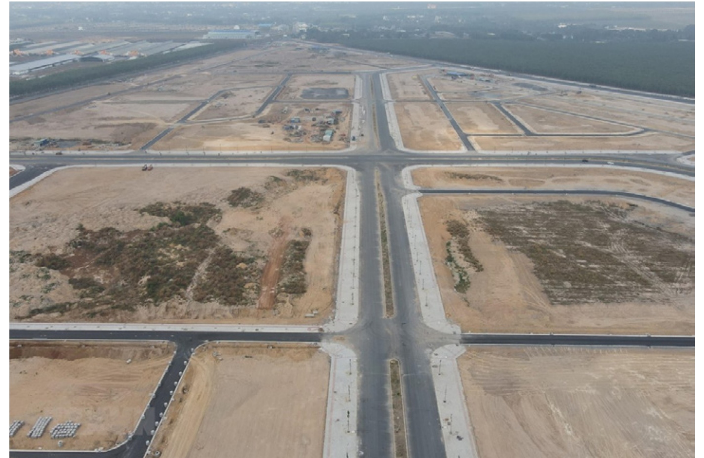
Toàn cảnh Khu tái định cư Lộc An - Bình Sơn.

Tại văn bản, Phó Thủ tướng Lê Văn Thành chỉ đạo UBND tỉnh Đồng Nai đẩy nhanh tiến độ triển khai dự án thu hồi đất, bồi thường, hỗ trợ, tái định cư Cảng Hàng không quốc tế Long Thành.